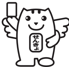
選挙の「めいすいくん」

※選挙公報の掲載順は、くじによって決められたものです。立候補の届出順とは異なる場合があります。